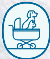
寵物車借用 (GF禮賓處)