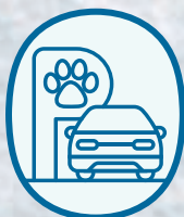
貓狗友善停泊位 (A119 車位)