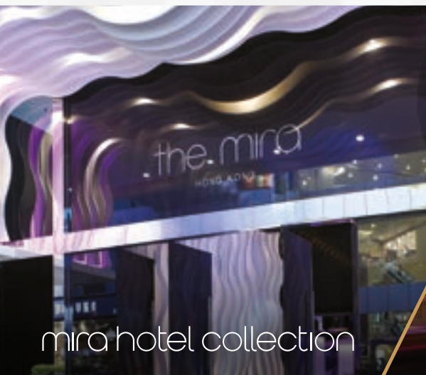
mira hotel collection