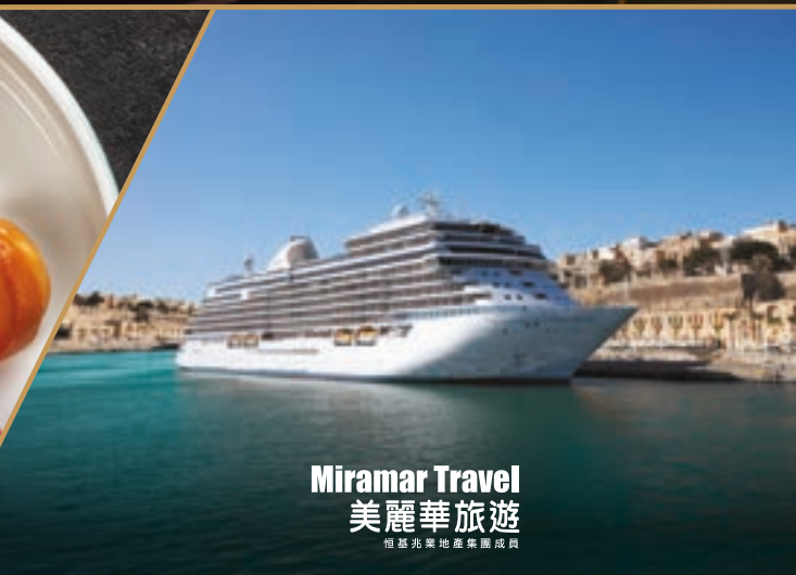
Miramar Travel 美麗華旅遊