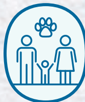
貓狗友善 家庭洗手間 (L3)