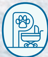
寵物車暫泊專區 (LG 露天廣場及 L1)