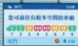
車廂載客情況顯示